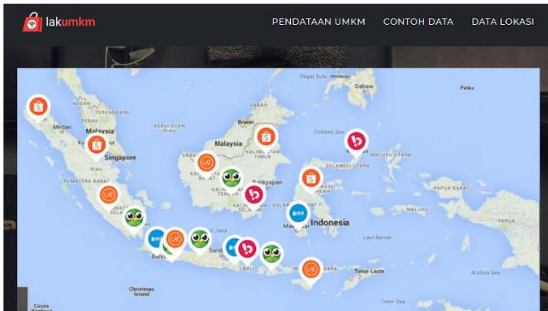
Tangkapan layar situs Lakumkm.id yang akan menjadi basis data UMKM di Indonesia (16/7).