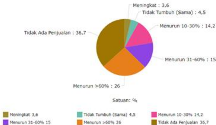
Gambar 1. Bagan Penurunan Penjualan Sektor UMKM Akibat Covid-19 (Jayani, 2020)