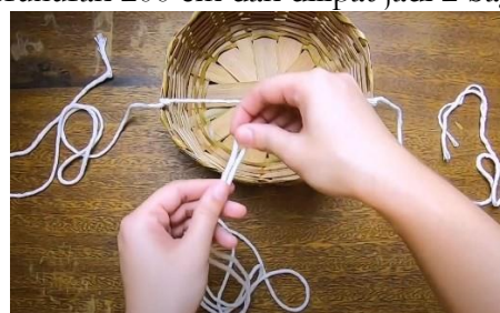
Gambar 13 Ikatan berikutnya pada piring rotan