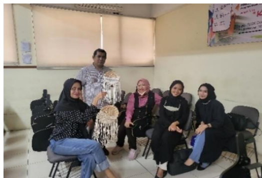
Gambar 3 Team Pelaksana workshop

Melakukan diskusi awal untuk mempersiapkan alat dan bahan serta membaginya kepada para peserta