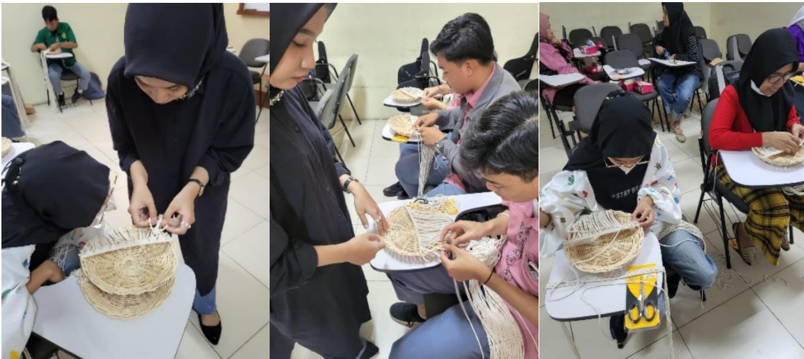
Gambar 8 Pendampingan pada Peserta