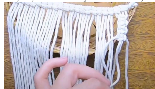
Gambar 22 Square 4 kotak