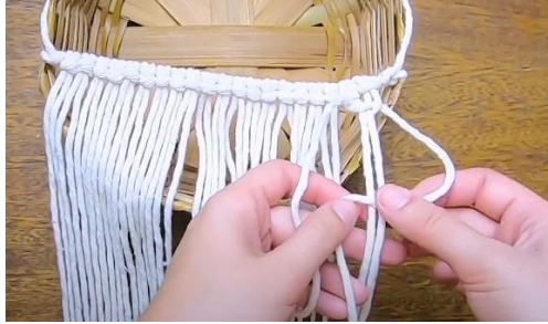
Gambar 20 Tarik setengah square