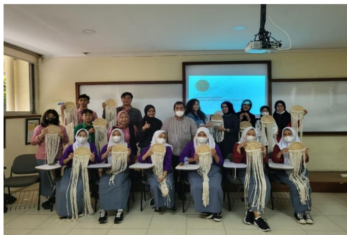
Gambar 27 Foto bersama pelaksana dan peserta