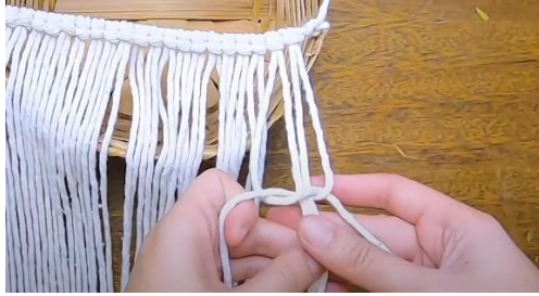
Gambar 19 Tali ke lobang