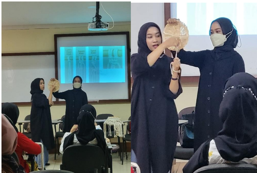
Gambar 6 Penjelasan oleh Instruktur