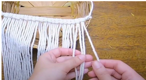
Gambar 16 Membuat simpul