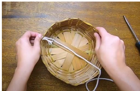
Gambar 12 Ikatan awal pada piring rotan