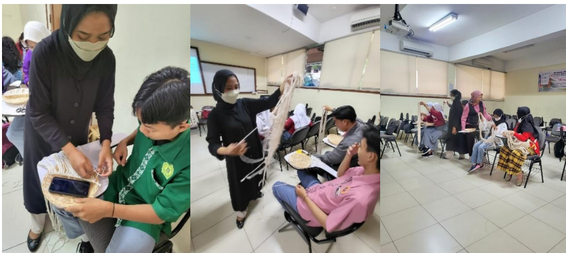
Gambar 9 Pendampingan pada Peserta