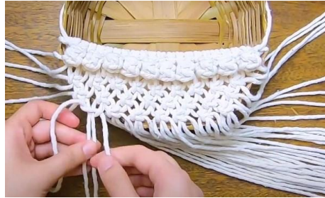
Gambar 24 Membuat segitiga