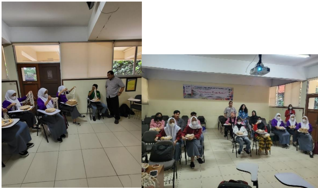
Gambar 11 Pendampingan oleh Ketua Pelaksana dan anggota

4. Berikut langkah-langkahnya sebagai berikut: