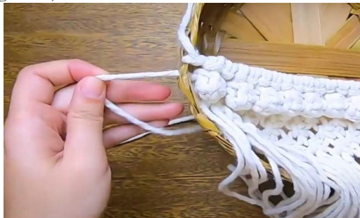
Gambar 25 Ikatkan semua tali