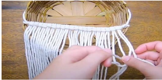
Gambar 15 Ikatkan tali menyeluruh