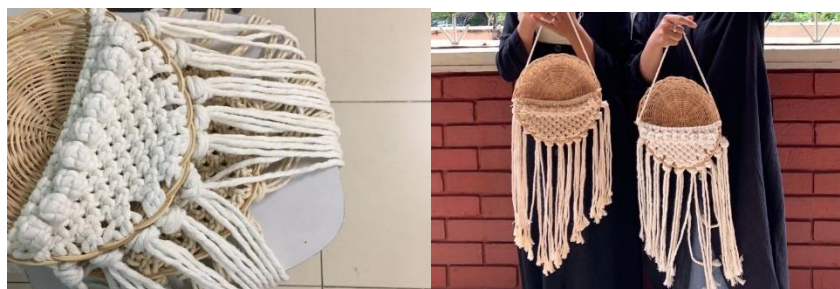
Gambar 26 Hasil akhir