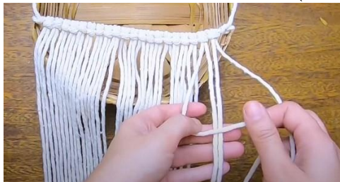
Gambar 17 Membuat square knot