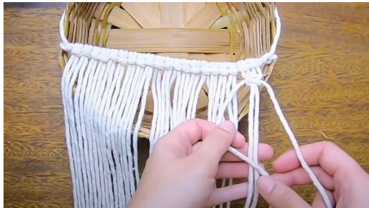
Gambar 21 Tarik 1 square