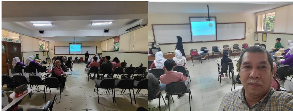
Gambar 5 Pemaparan Materi pada Peserta Workshop