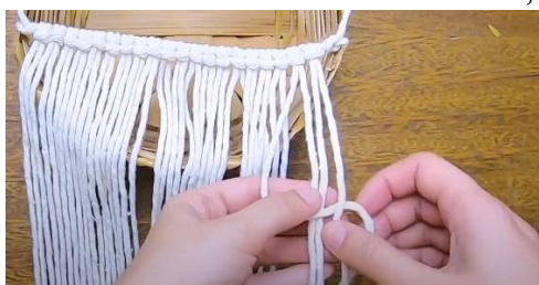
Gambar 18 Tali pada kanan ata