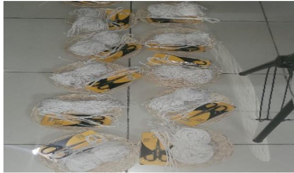
Gambar 4 Alat dan Bahan