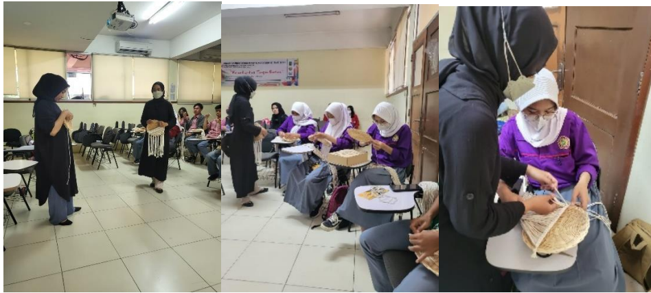
Gambar 7 Pendampingan oleh instruktur

3. Melakukan pendampingan dalam kegiatan worshop, ini dilakukan oleh team.