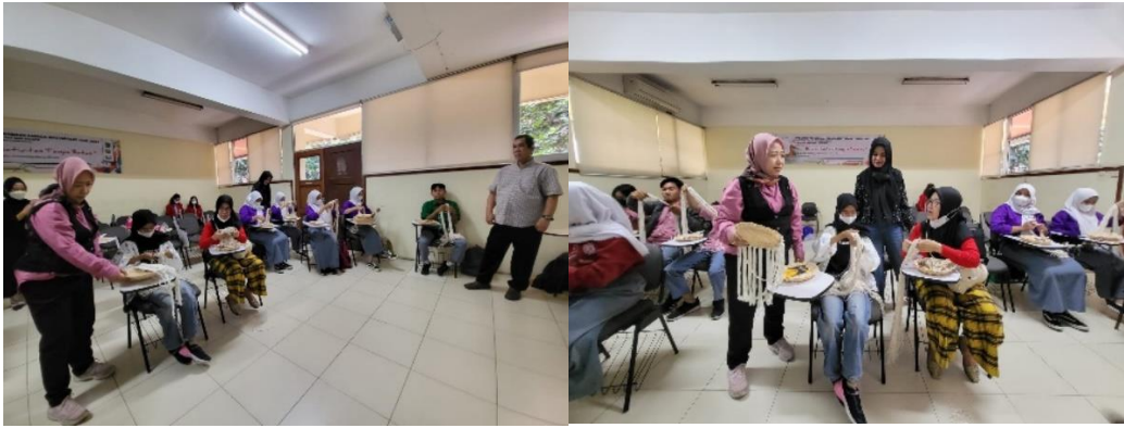
Gambar 10 Pendampingan oleh Ketua Pelaksana dan anggota