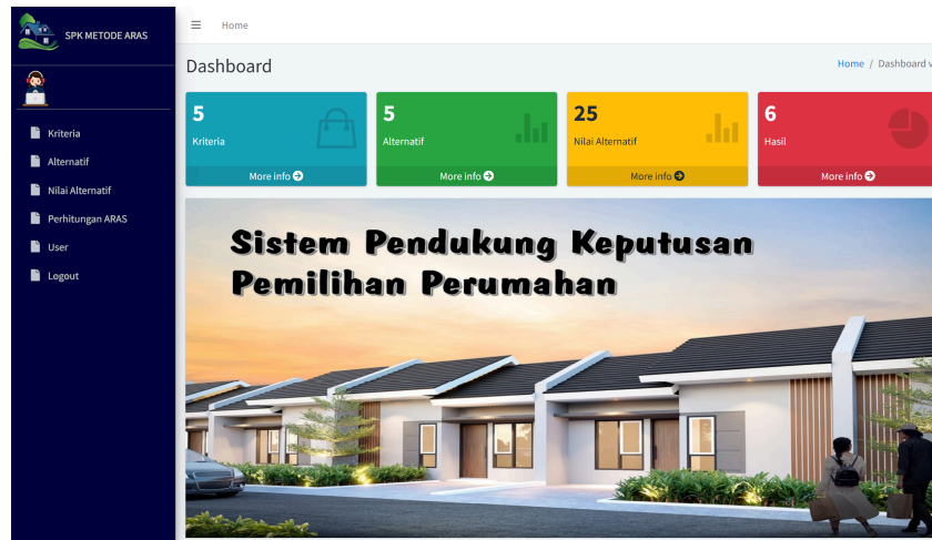
Gambar 2. Menu Utama Sistem Pendukung Keputusan Untuk Memilih Perumahan

Gambar 2 menampilkan antarmuka utama sistem yang memfasilitasi pengguna dalam mengelola kriteria, alternatif, nilai alternatif, dan menentukan keputusan dengan metode ARAS. Melalui menu Kriteria, pengguna dapat menambahkan, mengubah, atau menghapus daftar kriteria sesuai dengan kebutuhan evaluasi. Setelah itu, melalui menu Alternatif, pengguna dapat mengelola data perumahan yang akan dievaluasi. Setiap alternatif kemudian dinilai berdasarkan kriteria yang telah ditentukan melalui menu Nilai Alternatif. Pada menu ini pengguna juga dapat menambahkan, ubah maupun menghapus nilai alternatif. Fitur tambah data nilai alternatif divisualisasikan dalam Gambar 3.