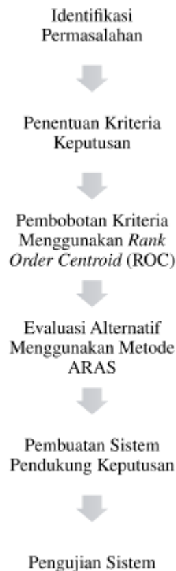
Gambar 1. Alur Tahapan Penelitian

Guna merealisasikan fokus penelitian ini, proses pelaksanaannya disusun secara sistematis melalui serangkaian tahapan yang saling terintegrasi dan dirancang untuk mendukung pencapaian hasil yang optimal. Tahapan-tahapan tersebut ditampilkan pada Gambar 1.