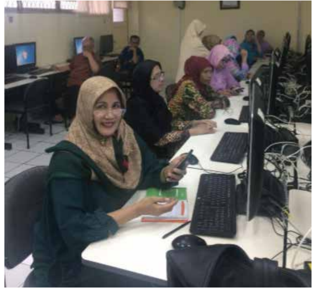
Gambar 5. Kegiatan pelatihan