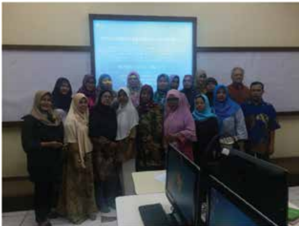
Gambar 4. Foto bersama dengan Peserta