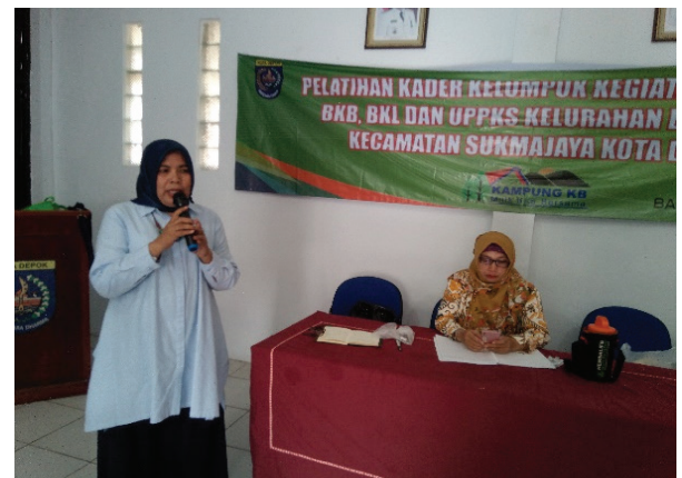
Tampak Pembawa acara memulai kegiatan dan memperkenalkan Tim Pengabdian Masyarakat dari Universitas Persada Indonesia YAI