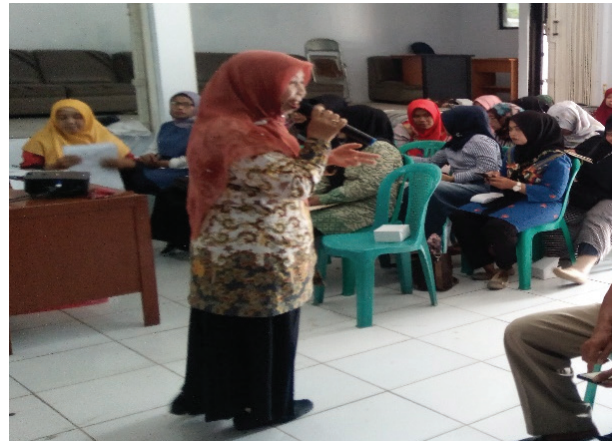
Tampak Pihak kelurahan saat menjelakan tentang kegiatan yang akan dilakukan pada kader UPPKS

Pelaksanaan Pengabdian Masyarakat telah kami lakukan pada tanggal 23 Oktober 2019. Dengan peserta kegiatan adalah anggota UPPKS Kelurahan Baktijaya