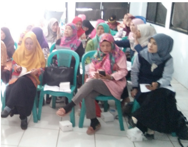
Tampak Peserta mendengarkan dan mencatat yang dijelaskan oleh penyuluh