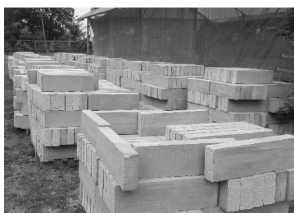
Gambar 2. Perawatan CLC