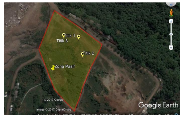
Gambar 2.1 Letak titik pengambilan sampel

Letak titik pengambilan sampel ditunjukkan seperti pada Gambar 2.1