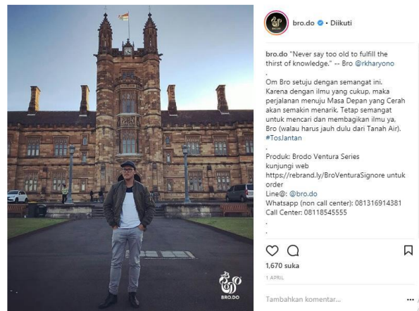
Gambar 4. Contoh Postingan Instagram Brodo