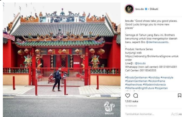
Gambar 1. Contoh Pesan Pemasaran Instagram Brodo