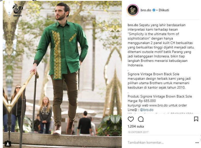
Gambar 3. Contoh Postingan Instagram Brodo