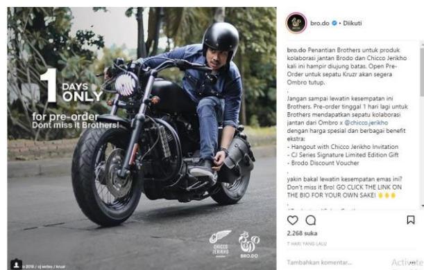
Gambar 5. Contoh Postingan Instagram Brodo

Pesan kreatif yang menjadi senjata utama Brodo dalam memasarkan produknya, dan instagram menjadi salah satu andalan mereka dalam berpromosi. Pesan-pesan kreatif mereka sampaikan sesuai pasar mereka anak muda pria usia 19-35 tahun yang mengikuti tren zaman masa kini misalnya pengambilan foto dan caption yang bertema, tampilan yang mencolok dan endorsement yang kesemuanya itu mereka lakukan sebagai perusahaan laba untuk