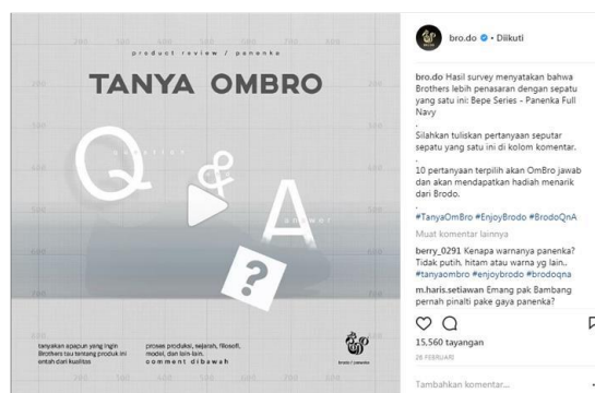
Gambar 7. Contoh Postingan Instagram Brodo

Pengelolaan pesan yang dilakukan Brodo dilakukan dengan teknik konten marketing, yang pada dasarnya adalah sebuah seni berkomunikasi dengan pelanggan ataupun calon pelanggan tanpa harus menjual. Daripada harus menawarkan produk atau jasa, pebisnis bisa