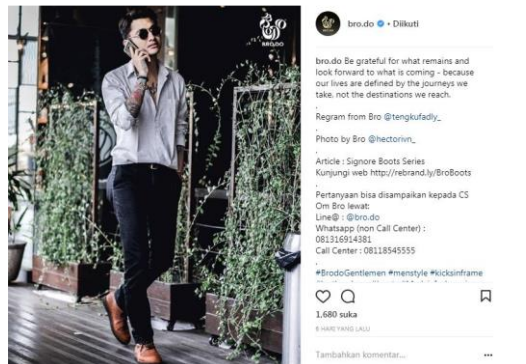
Gambar 6. Contoh Postingan Instagram Brodo