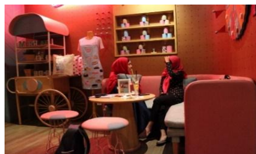
Gambar 3. Bantal Cushion bisa dipeluk