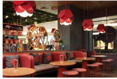
Gambar 9. Bantal & Ruang Cafe

Penerapan bantal cushion harus disesuaikan dengan tema dan desain ruangan agar tidak terlihat bertabrakan.