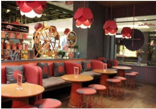
Gambar 14. Warna Bantal & Sofa

bantal cushion , dan aksesorisnya. Dan warna pink pastel diterapkan pada dinding berupa salur atau garis, pola pada tengah bantal cushion , kap lampu dan aksesoris. Adanya perpaduan warna tersebut menjadikan ruang terlihat harmonis.