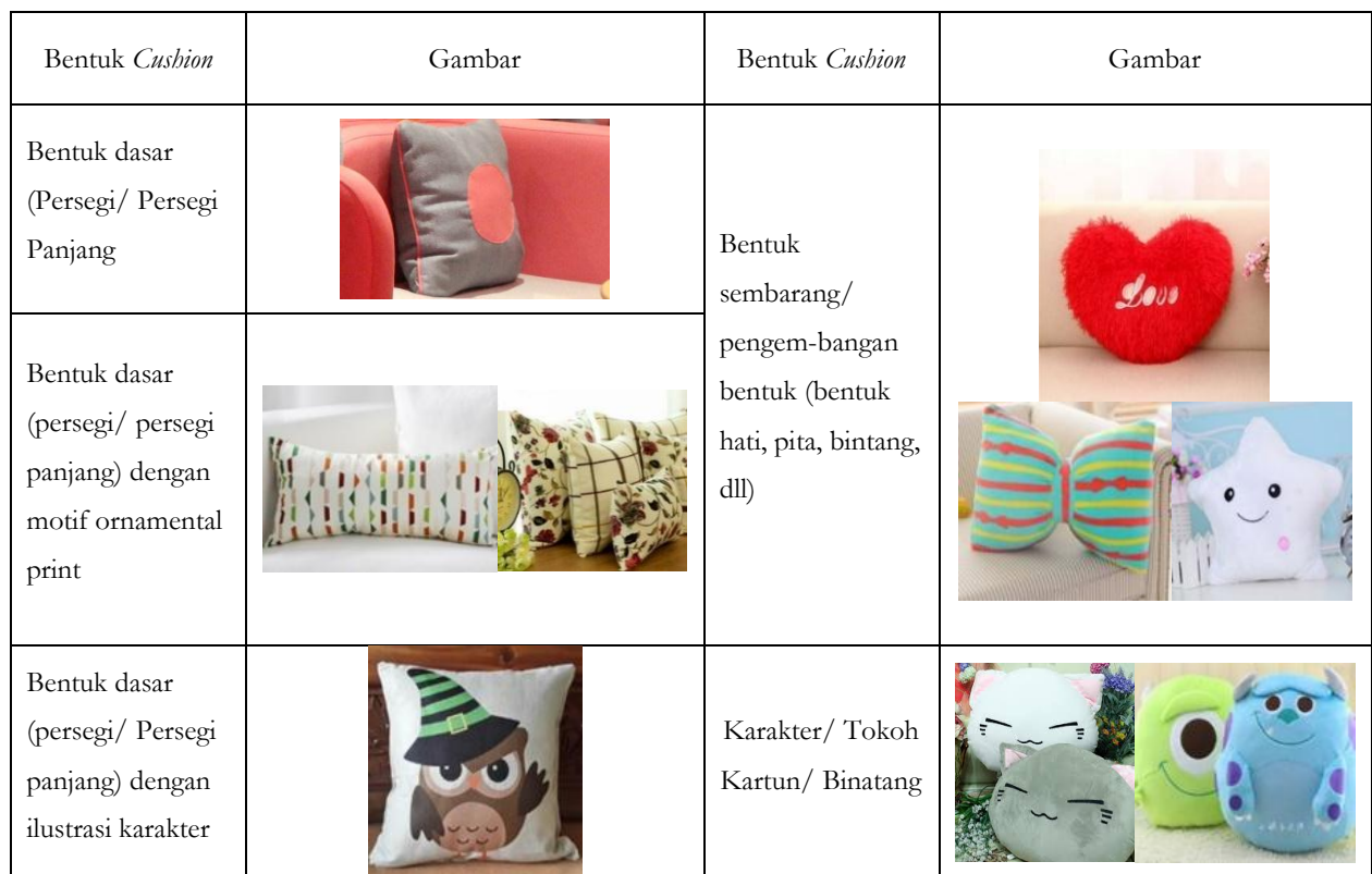
Tabel 1. Jenis Cushion berdasarkan Bentuk

Bantal cushion memiliki beragam bentuk, mulai dari bentuk dasar persegi/ bujur sangkar, bentuk geometrik sembarang, hingga bentuk yang meniru/menyerupai karakter/tokoh kartun dan binatang. Setiap bentuk dan warna bantal cushion selalu disesuaikan dengan ukuran dan warna sofa.