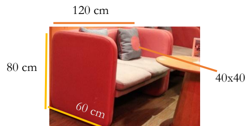
Gambar 10. Bantal & Sofa

dengan bentuk sofa yang digunakan dalam ruang cafe tersebut dengan jumlah dudukan untuk dua orang yang berukuran 120x60 cm.