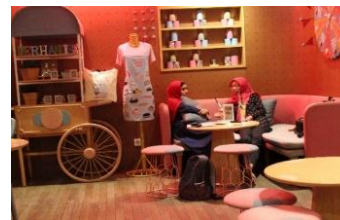
Gambar 12. Bantal & Sofa

Bantal cushion terlihat kurang nyaman ketika dipeluk karena terlalu menggebu