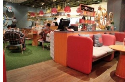
Gambar 6. Sofa, Aksesoris dan Dekorasi

tersebut akan berpengaruh pada tampilan sofa dan ruang kafanya. Sofa akan terlihat polos dan ruang pun terlihat kurang menarik.