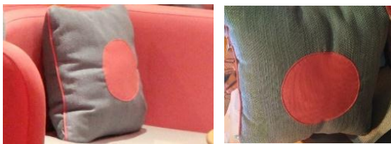
Gambar 1. Bentuk Cushion pada Café Collette & Lola (Pribadi)

Ilustrasi bentuk bantal yang digunakan pada Café Colette & Lola dapat dilihat pada gambar berikut ini.