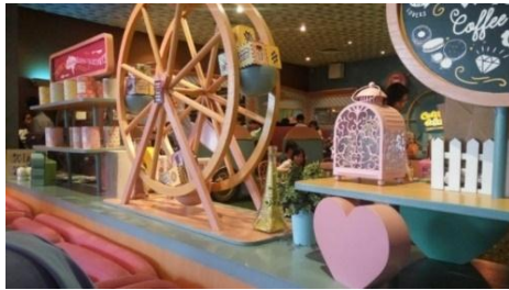
Gambar 5. Aksesoris dan Dekorasi (sumber: Pribadi)

interest pada sebuah ruang (Sufty Nurahmartiyanti, Agustin Rozalena, 2010:54).