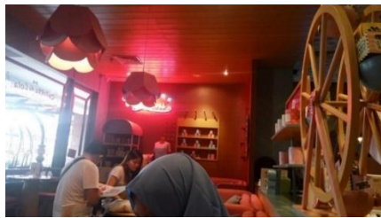
Gambar 7. Aksesoris dan Dekorasi

Aksesoris dan dekorasi yang dipajang di meja dan rak terlihat lucu dan menarik. Aksesoris dalam rak berupa kaleng yang didominasi dengan warna biru, kuning dan pink. Sebuah kincir dari kayu, dalam setiap sisi-sisinya terdapat wadah yang berisi packaging dan aksesoris-aksesori lainnya.