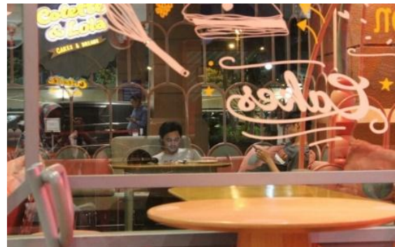
Gambar 2 Fungsi bantal cushion untuk sandaran

Sebagai pelengkap sofa dalam sebuah kafe, bantal cushion ini digunakan untuk memenuhi kebutuhan pelanggan seperti pada gambar berikut ini.