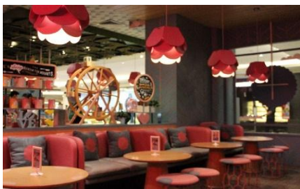
Gambar 8. Sofa, Aksesoris dan Dekorasi

Sofa mungil yang menempel pada dinding serta penambahan bantal cushion menjadi penambah daya tarik pada sofa tersebut. Ketiadaan bantal cushion dalam sofa