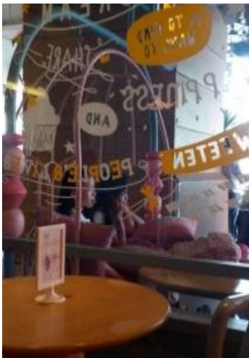
Gambar 4. Bantal Cushion bisa dipangku

Selain digunakan sebagai pemenuhan kebutuhan pelanggan dalam memberikan kenyamanan ketika sedang duduk, bantal cushion ini juga digunakan untuk memenuhi kebutuhan kafe yaitu sebagai pelengkap interior cafe, agar ruang cafe atau interior terlihat menarik dan lebih nyaman.