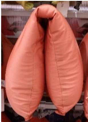
Gambar 16. Bantal Leher U-Shaped