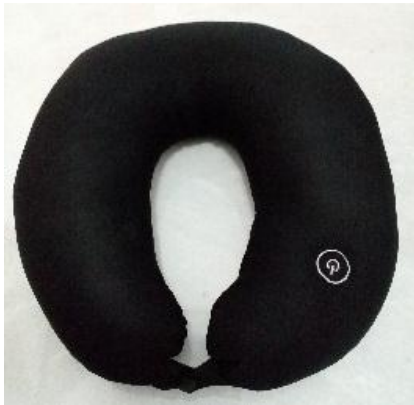
Gambar 19. Bantal Leher Pijat

leher huruf U pada umumnya, hanya saja terdapat penambahan sistem pemijat pada bagian dalam bantal. Beban bantal ini lebih berat dari bantal leher biasa, dan keterbatasan ruang gerak pengguna karena adanya sistem pemijat dibagian dalamnya.