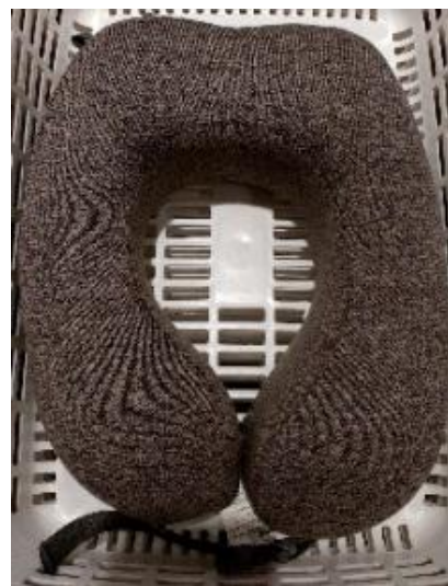
Gambar 10. Bantal U