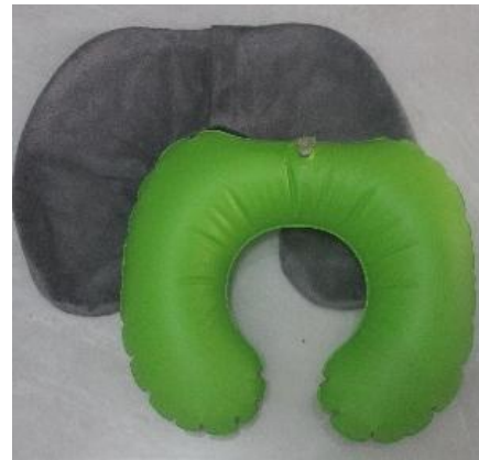
Gambar 14. Bantal Leher Tiup

Untuk dapat menggunakan bantal ini, pengguna harus mengisi bantal dengan dengan cara ditiup agar bantal mengembang. Kelebihan dari bantal ini adalah tekanan dapat disesuaikan sesuai keinginan pengguna. Ketika pengguna berada dalam pesawat yang sedang mengudara, tekanan udara pada bantal akan mengalami perubahan. Menurut hasil wawancara, tekanan dalam bantal akan berubah semakin keras sehingga cengkaman pada leherpun semakin keras.