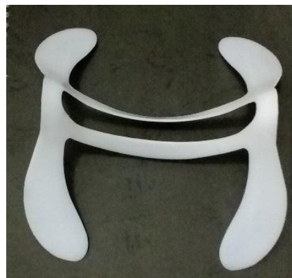
Gambar 18. Ribs dalam Bantal Leher TRTL