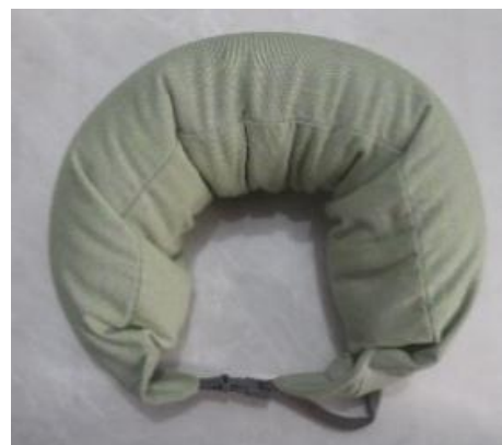
Gambar 15. Bantal Leher U-Shaped

Bentuk bantal ini panjang seperti guling jika kedua ujung bantal tidak dikancingkan. Bantal ini lebih fleksibel jika dibantingkan dengan bantal leher yang berbentuk U. Bentuk bantal juga dapat diatur sesuai keinginan.