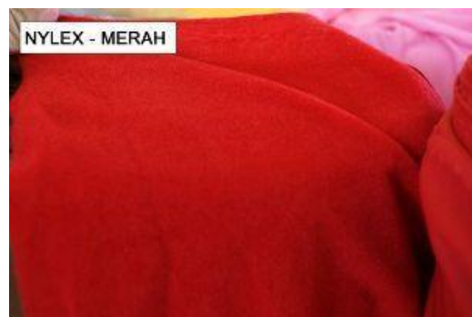
Gambar 4. Kain Nylex