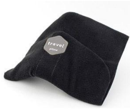
Gambar 17. Bantal Leher TRTL

untuk menopang bagian kepala dan leher pada bahu. Bantal ini sangat fleksibel dan simpel, tidak membutuhkan banyak ruang penyimpanan. Namun, kurang nyaman saat digunakan karena hanya akan menopang salah satu bagian yang terdapat ribs. Sedangkan bagian kepala lainnya yang tidak terdapat ribs tidak ada sandarannya.