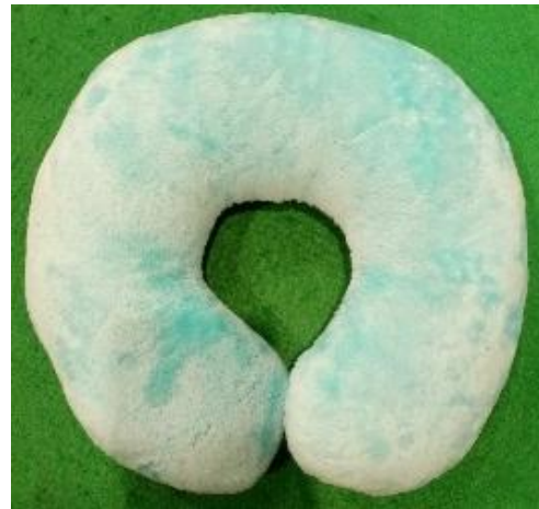
Gambar 9. Bantal U

Penggunaan bantal leher berbentuk U ini adalah yang paling umum. Namun, bantal ini hanya menyediakan fasilitas sebagai penopang leher saja tanpa ada fungsi tambahan lainnya. Berbeda halnya jika ditambahkan aksesoris pada setiap ujung untuk mengikat sisi satu sama lainnya, agar bantal tidak terlepas saat digunakan. Aksesoris bisa berupa kancing atau pengikat dengan kuncian.