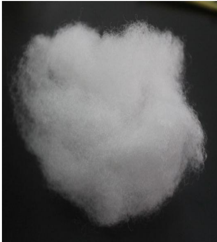
Gambar 5. Dakron

Selain digunakan untuk bahan pengisi bantal dakron juga digunakan sebagai bahan untuk pengisi boneka, guling, bed cover, furniture, dan produk lainnya. Saat ini dipasaran ada beberapa jenis dakron yang beredar dengan kualitas yang berbeda-beda. Aneka jenis dakron tersebut adalah Siliconized Polyester Fiber, Silicon, dan Dakron Reguler.