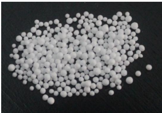
Gambar 8. Manik-manik

tidak mudah panas. Bahan manik-manik ini menjadi populer dan karena bentuk dan tekstur yang unik. Namun, bahan ini memiliki kekurangan yaitu tidak dapat dicuci dengan air lalu dijemur dibawah sinar matahari seperti bantal yang terbuat dari bahan yang lain. Perawatan bantal dengan isi manik-manik adalah dengan menyimpannya di suhu ruangan yang tidak terlalu panas atau dingin. Manik-manik dapat bertahan 1-5 tahun tergantung kualitas manik-manik itu sendiri.