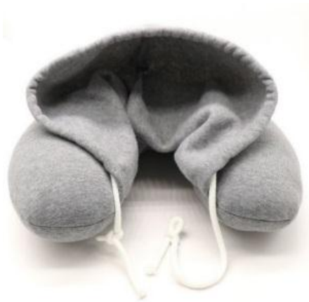
Gambar 13. Bantal leher hoodie