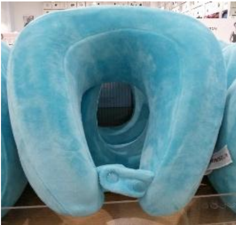
Gambar 11. Bantal U