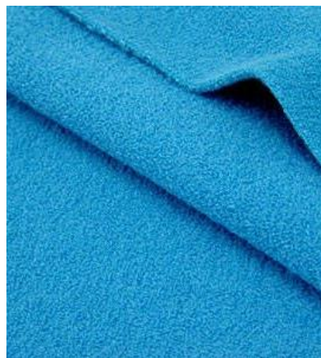
Gambar 1. Kain fleece