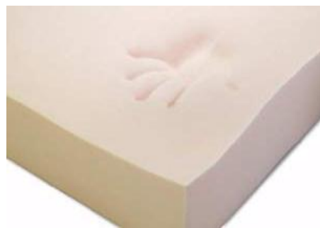
Gambar 7. Memory foam saat setelah menerima tekanan