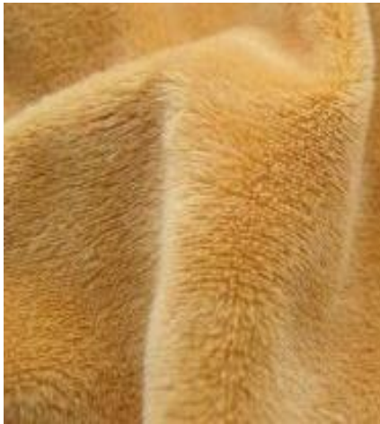
Gambar 2. Kain Velboa

satu bahan kain berkualitas untuk bahan luar pembuatan boneka dan bantal. Variasi warnanya juga lebih beragam dan sangat lengkap. Mulai dari warna kuning, hijau, pink, merah, ungu, biru, serta bermacam-macam warna cerah lainnya.