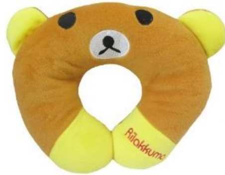
Gambar 12. Bantal leher karakter kartun

anak-anak, karakter yang menampilkan logo dari klub olahraga untuk para supporter dari masing-masing klub, dan sebagai media promosi sebuah perusahaan.