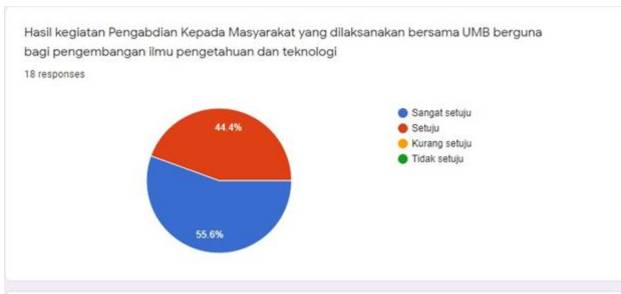
Gambar 2. Hasil Pengabdian Kepada Masyarakat

Hasil dari di lakukan Pengabdian Kepada Masyarakat ini terhadap layak ramai, adalah: