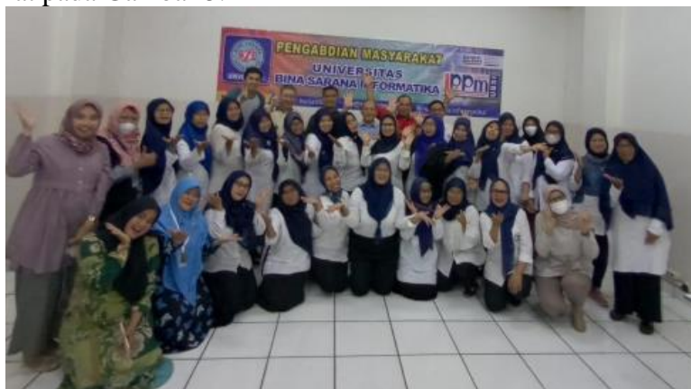
Gambar 5. Foto Bersama Panitia dan Peserta Pelatihan

Setelah rangkaian acara berakhir, panitia pengabdian masyarakat melakukan foto bersama para peserta, seperti terlihat pada Gambar 5.