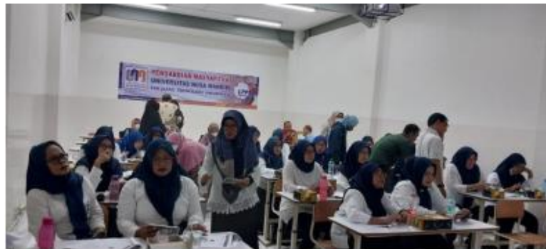
Gambar 4. Praktik Langsung oleh Peserta

Setelah rangkaian acara berakhir, panitia pengabdian masyarakat melakukan foto bersama para peserta, seperti terlihat pada Gambar 5.