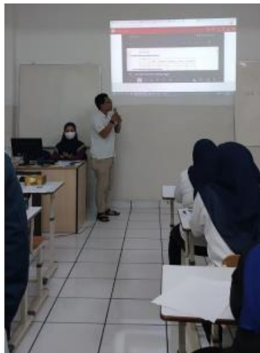
Gambar 2. Pemberian Materi Dengan Metode Ceramah

Sebelum membahas materi penggunaan aplikasi Google Sheets, narasumber terlebih dahulu menjelaskan tentang sejarah, kegunaan, dan fitur-fitur Google Sheets kepada peserta pelatihan, seperti pada Gambar 2. Dan dilanjutkan dengan live demo penggunaan aplikasi Google Sheets, seperti pada gambar pada Gambar 3.