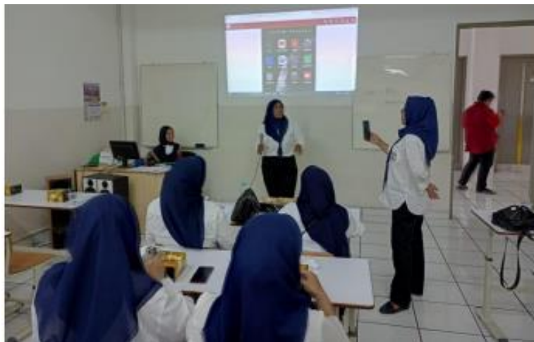
Gambar 3. Pemberian Materi Dengan Metode Demonstrasi

Sebelum membahas materi penggunaan aplikasi Google Sheets, narasumber terlebih dahulu menjelaskan tentang sejarah, kegunaan, dan fitur-fitur Google Sheets kepada peserta pelatihan, seperti pada Gambar 2. Dan dilanjutkan dengan live demo penggunaan aplikasi Google Sheets, seperti pada gambar pada Gambar 3.