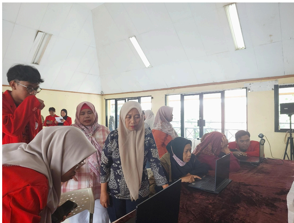
Gambar 4. Pelaksanaan Kegiatan Sosialisasi Sosialisasi Aplikasi Pendeteksi Diabetes