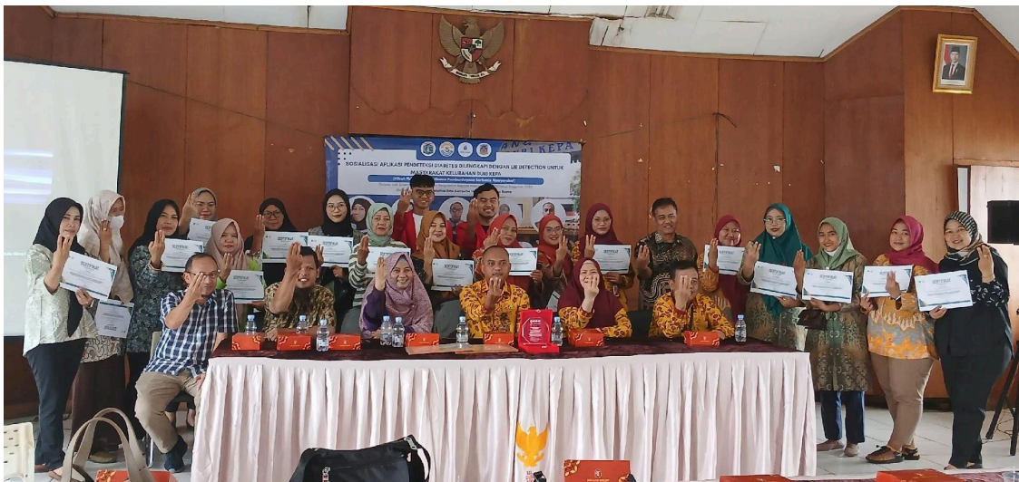
Gambar 3. Pelaksanaan Kegiatan

Tujuan utama dari kegiatan ini adalah mensosialisasikan penggunaan aplikasi pendeteksi risiko penyakit diabetes berbasis deteksi kebohongan sebagai bentuk penerapan teknologi informasi di bidang kesehatan. Aplikasi ini dirancang untuk membantu masyarakat mengenali potensi risiko diabetes melalui analisis sederhana berbasis deteksi reaksi fisiologis dan respons pengguna, tanpa menggantikan fungsi diagnosis medis profesional.