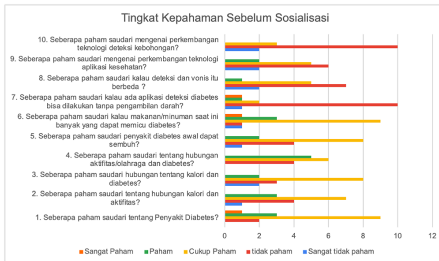
Gambar 1. Grafik tingkat keahaman sebelum sosialisasi

Dari grafik gambar 1 maka dapat kita lihat hampir disetiap pertanyaan yang berhubungan dengan diabetes banyak yang belum mengetahui. Tingkat ketidakpahaman pada pertanyaan nomor 7 dan nomor 10, mereka banyak yang belum mengetahui kalau ada aplikasi yang dapat mendeteksi penyakit diabetes. Dengan adanya hal ini, maka kita ingin mensosialisasikan adanya Aplikasi pendeteksi penyakit diabetes dengan deteksi kebohongan. Konsep disini hanya ingin membedakan antara deteksi dan vonis. Deteksi disini nanti kita akan mengeluarkan hasil diabetes tipe 1, tipe 2 atau tidak terdeteksi. Terdeteksi di aplikasi ini hanya akan menjadi reminder bagi individu agar dapat lebih menjaga pola makan dan pola aktifitas untuk dapat hidup lebih sehat, tentunya juga nantinya akan di sosialisasikan dengan bantuan aplikasi welth .