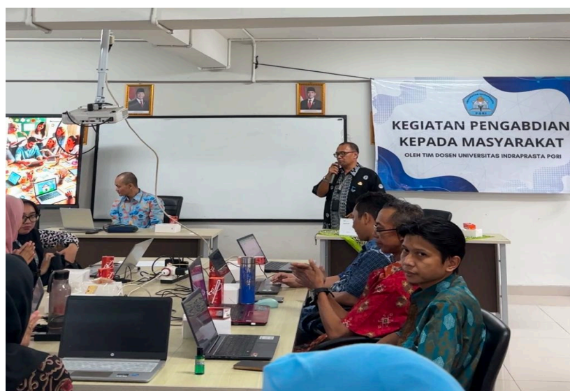
Gambar 2. Sambutan dari Kepala Sekolah SDN Ragunan 08

Kegiatan pelatihan diawali dengan sambutan dari Kepala Sekolah SDN Ragunan 08 yang memberikan dukungan terhadap pelaksanaan program pengabdian kepada masyarakat serta menekankan pentingnya pemanfaatan teknologi pembelajaran di era digital.