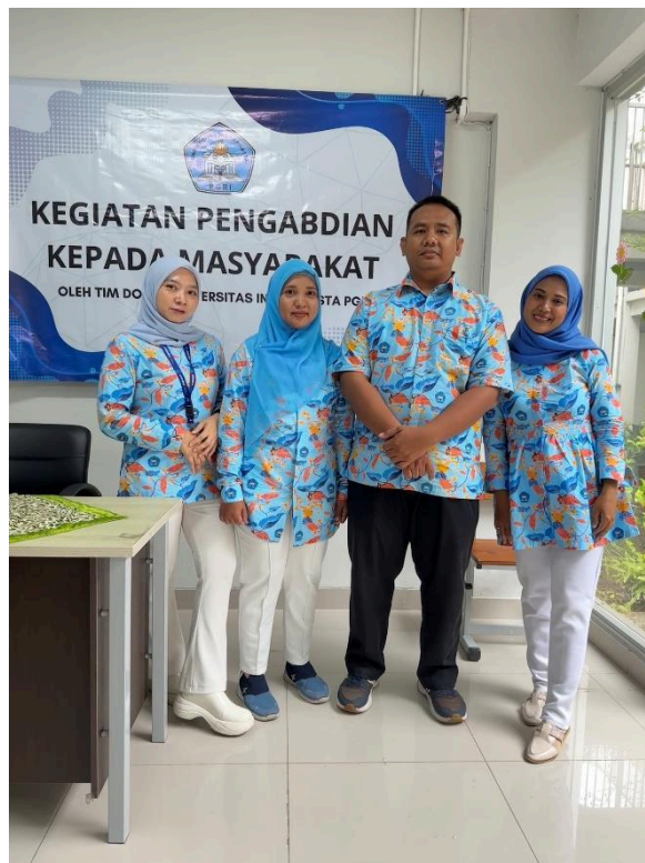
Gambar 5. Tim Pelaksana PkM

mendapatkan dukungan penuh dari pihak sekolah. Kehadiran peserta sangat baik, dan antusiasme mereka tinggi karena materi Scratch merupakan hal baru yang sangat relevan dengan pembelajaran modern.