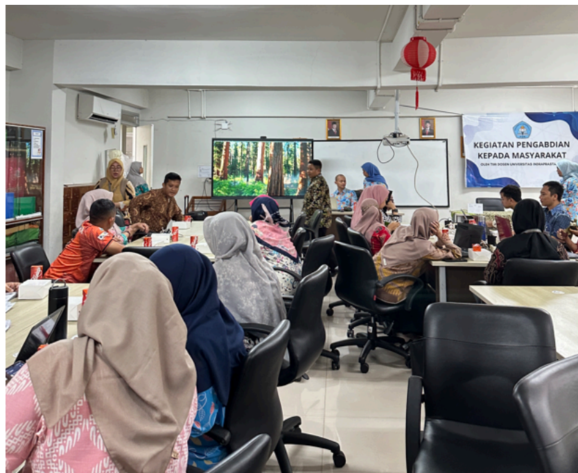
Gambar 4. Peserta PkM

Selama pelatihan berlangsung, para peserta secara aktif mengikuti sesi praktik pembuatan animasi sederhana menggunakan aplikasi Scratch dengan pendampingan langsung dari tim pelaksana.