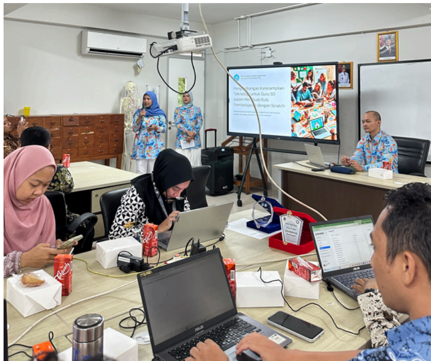
Gambar 3. Pemaparan materi oleh tim PkM

Selama pelatihan berlangsung, para peserta secara aktif mengikuti sesi praktik pembuatan animasi sederhana menggunakan aplikasi Scratch dengan pendampingan langsung dari tim pelaksana.