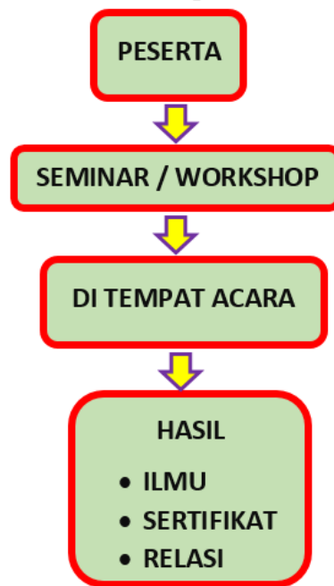
Gambar 2. Sistem Seminar atau Workshop sebelum Coronavirus Disease 2019 (Covid-19)

Berdasarkan gambar diatas maka dapat disimpulkan sebelum pandemic virus Corona semua peserta berkumpul di satu tempat untuk mengikuti acara seminar atau workshop, sebelum pandemic virus Corona acara belajar seminar dan Workshop biasanya dilakukan dengan sistem tatap muka di suatu tempat dengan peserta yang banyak namun pada masa pandemic sekarang ini hal tersebut tidak akan bisa dilakukan dan oleh karena itu sistem seminar dan Workshop dirubah menjadi online, seminar dan workshop menghasilkan ilmu yang bermanfaat, sertifikat, relasi sesama peserta seminar dan workshop [1].