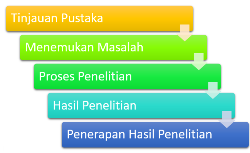
Gambar 1. Metode Penelitian