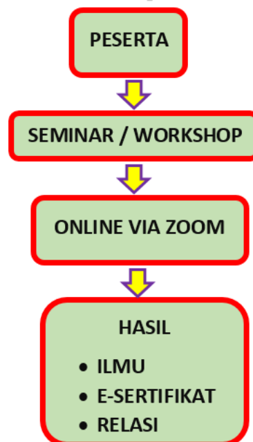
Gambar 3. Sistem Seminar atau Workshop pada saat Coronavirus Disease 2019 (Covid-19)

Berdasarkan gambar diatas maka dapat disimpulkan sebelum pandemic virus Corona semua peserta berkumpul di satu tempat untuk mengikuti acara seminar atau workshop, sebelum pandemic virus Corona acara belajar seminar dan Workshop biasanya dilakukan dengan sistem tatap muka di suatu tempat dengan peserta yang banyak namun pada masa pandemic sekarang ini hal tersebut tidak akan bisa dilakukan dan oleh karena itu sistem seminar dan Workshop dirubah menjadi online, seminar dan workshop menghasilkan ilmu yang bermanfaat, sertifikat, relasi sesama peserta seminar dan workshop [1].