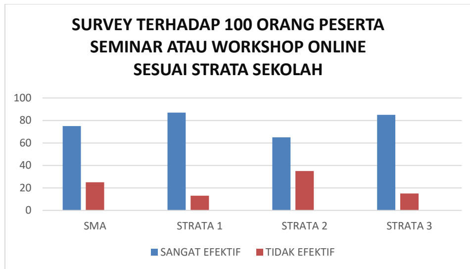
Gambar 5 Hasil Survei Yang Dilakukan Kepada Peserta Seminar Atau Workshop

Berdasarkan hasil survei di atas yang dilakukan kepada peserta seminar dan Workshop yang dilakukan secara online selama pandemic di bulan april 2020 sampai agustus 2020 dan dilakukan kepada peserta workshop berdasarkan strata pendidikan dari SMA sampai strata 3, maka dihasilkan bahwa mayoritas setuju bahwa seminar dan Workshop sangat efektif jika dilakukan secara online dengan menggunakan aplikasi Zoom, dan penyampaian materi bisa maksimal berdasarkan hasil survei biasa juga dapat diketahui mayoritas setuju seminar dan Workshop dilakukan secara online.