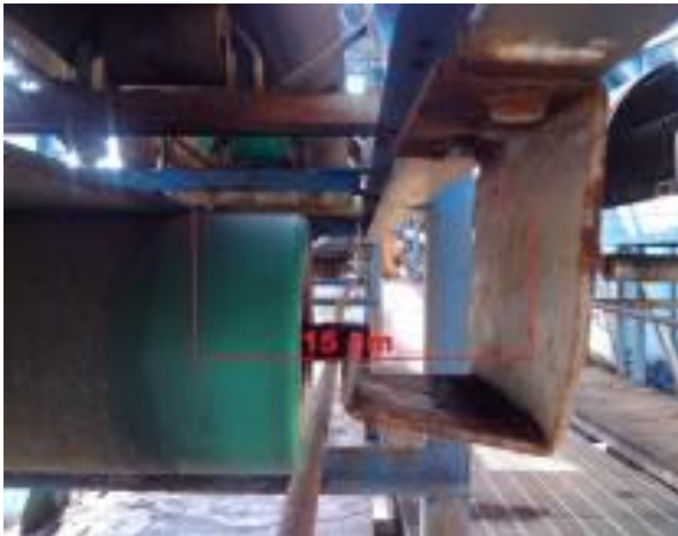
Gambar 3. Support Return Modifikasi Ash Handling

Dengan merubah bentuk dan dimensinya, support return model baru telah berhasil mengatasi masalah belt sobek yang disebabkan oleh gesekan belt dengan support return ketika belt jogging terjadi. Jarak belt dengan support return model baru ketika dipasang yaitu 15 cm, sehingga ketika terjadi belt jogging pada bagian return belt akan tetap aman karena tidak bergesekan dengan support return . Gambar 3 memperlihatkan Support Return Ash Handling yang telah dimodifikasi.