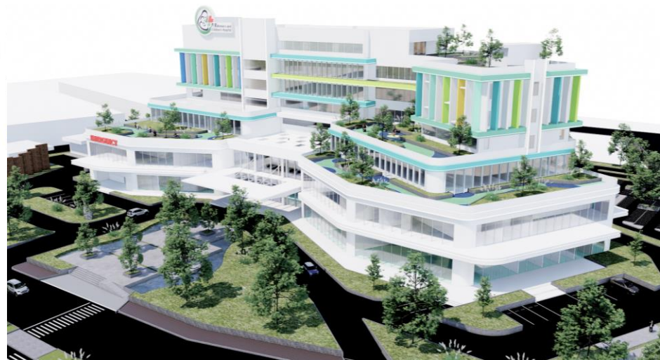
07 MASA AKHIR. Bangunan pada Rumah Sakit Ibu dan Anak ini menerapkan tema COLORFUL FIN dengan menggunakan warna-warna cerah agar menarik perhatian bagi penglihatannya sekaligus merepresentasikan bangunan yang ramah terhadap anak. Bangunan ini dirancang dengan dominan warna putih agar terlihat lembut dan bersih sebagai bangunan Rumah Sakit Anak. Pada fasad nantinya akan ditanami berbagai jenis tanaman untuk memberikan kesan menyatu dengan alam yang maksimal.