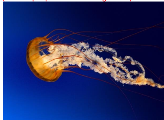
Gambar 1. Abc