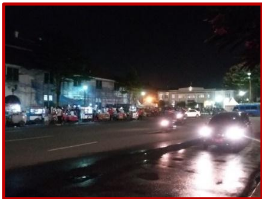
Gambar 4. Kondisi Koridor Jalan Lada