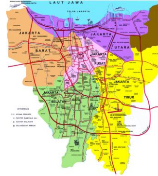
Gambar 1. Peta Jakarta

Jalan Lada adalah koridor jalan yang berada dikawasan bersejara Kota Tua Jakarta yaitu sebelah timur taman Fatahillah dan berseberangan dengan bangunan BNI 46. Koridor jalan ini menjadi saksi perkembangan zaman dan modernisasi DKI Jakarta. Dimana bangunan disepanjang koridor adalah bangunan bersejarah, namun pada malam hari muka bangunan tertutup oleh gerai-gerai pedagang kaki lima yang berjajar disepanjang koridor.