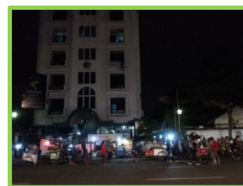
Gambar 3. Kondisi Koridor Jalan Lada